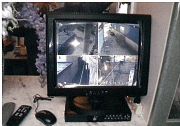
防災・防犯設備工事・メンテナンスをしております。

私が圧倒されたのが、朝から大きな声でおはよ うございますと言う挨拶と、皆さんの姿勢がすごく いいことでした。役員朝礼は姿勢の角度から、どの くらいの間隔で頭を上げるとか、すべて初めての 経験でした。また那須野ヶ原倫理法人会広報委員 会は講話のレポートを取る係りでした。最初は午 前中いっぱいかかりながらレポートを書いていまし た。それを毎週繰り返し返しているうちに講話のポイン トや、何が言いたいのかを読み取れるようになりま した。私は昔から人前で話すのが苦手でした。それ でも小学校のPTA活動などやっていました。PTA でも小学校のPTA活動などやっていたのですが、PTA 会長長の役職が回ってきた時に、大勢の前で何を 話したらいいのか？凄く悩みましたが、倫理のモー ニングセミナーで聞いた事が頭に残っていて、す らすらと話が出来たことを覚えております。倫理で 何気なくやっていたことが凄く役に立ったのと、実 践で生かされていた。良い習慣を付けると知らず知 らずのうちに自分の力となるものだと凄く感じ ました。今年は広報委 員長として頑張ってお りますが、まだまだ字 ばなくてはないこと が沢山あります。いろ んなことに挑戦し、倫 理を自分の成長させる 場として活用させてい ただきたいと思ってお ります。