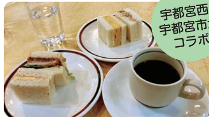
宇都宮西・宇都宮市北 コラボ

とんかつ、ハム&チーズ、たまご、ツナなど種類豊富で、淹れたてのコーヒーにとても合うサンドイッチです!